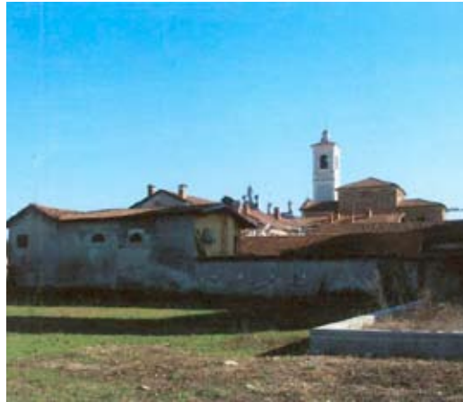
Area verde in prossimità dell'ex collegio Somaschi

Nel 2010 sono previsti i seguenti lavori pubblici che superano tale entità: primo lotto per la sistemazione dell'area verde in prossimità dell'ex collegio dei "Somaschi" attiguo al Santuario barocco dedicato alla Madonna del Popolo, lo stanziamento è di €100.000,00; ristrutturazione di una porzione di Palazzo Salmatoris acquistata recentemente dal Comune, contigua alla parte già in proprietà utilizzata per le mostre ed eventi più importanti della Città, l'intervento avverrà in lotti, quest'anno è previsto un impegno di spesa pari a € 120.000,00; lo smaltimento delle acque meteoriche in Via Savigliano della frazione Roreto necessario per risolvere i problemi di quella zona a rilevante densità artigianale che si verificano in concomitanza di fenomeni piovosi eccezionali, la stima dei costi è pari a € 100.000,00; sono previsti, da ultimo, alcuni lavori di manu-