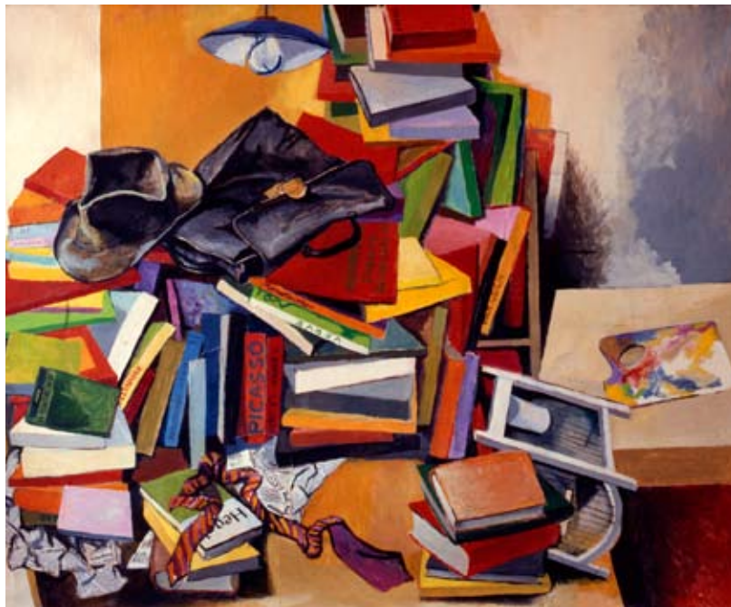
RENATO GUTTUSO, Libri, lampada e gabbia in via Pompeo Magno , 1966 olio su tela, cm 120x153

si rappresentano invece i movimenti e le ideologie nate di riflesso all'arte fascista. Al piano superiore di Palazzo Salmatoris è